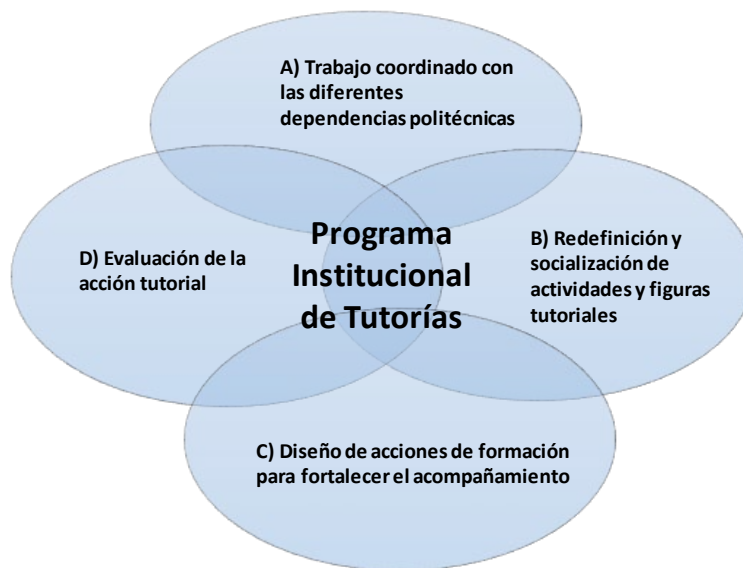
Figura 1. Estrategias para la operación del PIT

Para la adecuada operación del PIT es necesario llevar a cabo esfuerzos conjuntos, liderados por la CITP, con el compromiso de las Unidades Académicas y las dependencias politécnicas involucradas para la atención oportuna de los alumnos, siendo obligado que los implicados tengan una visión amplia e incluyente, tomando en consideración que la comunidad estudiantil posee características diversas y en tal sentido el acompañamiento que se brinde, debe adecuarse a los rasgos particulares de cada Unidad Académica, grupos e individuos y por ende las estrategias de atención e intervención deberán cubrir el amplio espectro de particularidades.