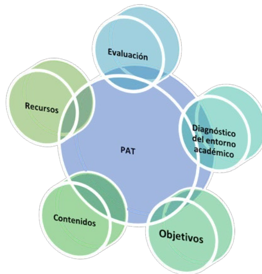
Figura 3. Actividades del Plan de Acción Tutorial

La planificación del PAT deberá contener las actividades programadas y secuenciadas en torno a las necesidades de formación, información y acompañamiento del alumnado. Adicionalmente, es necesario tener en cuenta que el PAT debe ser suficientemente flexible para incorporar posteriormente otras acciones extraordinarias que no hayan sido consideradas y sean resultado de modificaciones de último momento o la propia dinámica académica.